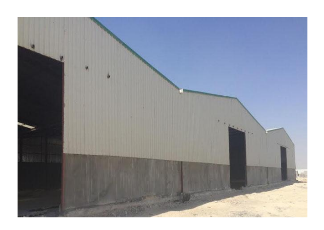
See what we do