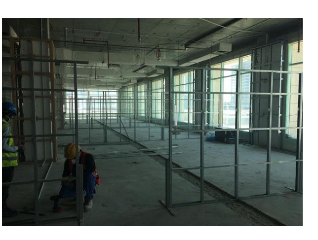
See what we do