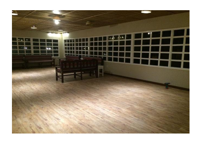
See what we do